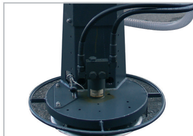
Der Streuteller und Trichter sind aus rostfreiem, lackiertem Stahl.