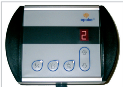
Die EpoSet Fernbedienung wird im Fahrerhaus montiert für die Bedienung von Start/Stop der Streuung, der Streubreite, Rundumkennleuchte und Arbeitslicht.