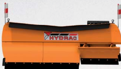
SCHNEEPFLÜGE von 1,3 - 4,2 m Baubreite