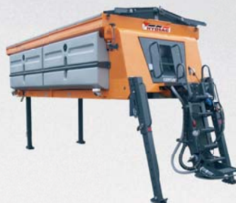
STREUGERÄTE von 0,6 - 17,5 m 3 Inhalt