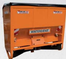
STREUGERÄTE von 0,2 - 2,1 m 3 Inhalt von 1,5 - 8 m Streubreite