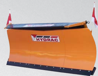
SCHNEEPFLÜGE von 1,3 - 4,2 m Baubreite