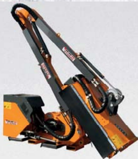
BÖSCHUNGSMÄHER von 3,2 - 8 m Auslegerweite