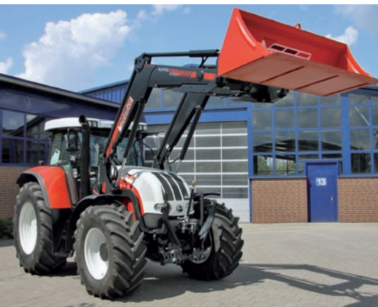
Den Frontlader abzubauen, ohne die Kabine zu verlassen, kostet rund 1.800 Euro und gibt es nur bei Hydrac.

Wir haben bei unseren Messungen die Traktoren hinten an der Ackerschleife gesichert. So konnten wir die maximalen Hub- und Reißkräfte messen. Dies war für den Vergleich von Vorteil, da die Geometrie und die Ballastierung des Traktors keine Rolle spielen und die maximalen Kräfte des Laders gemessen werden konnten. Sie werden die Kräfte im Praxiseinsatz kaum erreichen, da der Schlepper in der Regel nicht so ballastiert werden kann, dass er hinten nicht hoch geht. Zudem ist die Messung nur mit einem festgezurrten Schlepper gefahrlos möglich. Wir haben für die Messung der Hub- und Reißkräfte alle Lader mit demselben Traktor gespeist. So hatten alle Lader die gleichen Bedingungen im Hinblick auf die Hydraulikleistung.