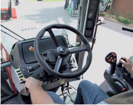
AutoLock bedeutet Laderabbau, ohne den Schleppersitz zu verlassen. Links ist das extra Bedienteil für den Hydrac-Lader.

verschiedene Angaben. Normalerweise wird die Achslast für die Höchstgeschwindigkeit angegeben. Diese wird jedoch oft überschritten. Für den Einsatz mit dem Lader gilt die Achslast bis 10 km/h. Beim Arbeiten mit dem Frontlader ist die dynamische Belastung bis 10 km/h geringer. Das heißt bis 10 km/h verträgt die Achse höhere Kräfte als bis 40 km/h. Die maximalen Losbrechkräfte treten auf, wenn der Traktor steht. Dann vertragen die Achsen mehr.