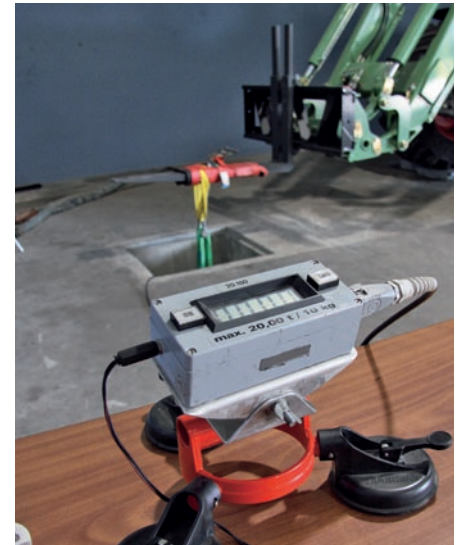
Die Zugkraftmessdose sitzt in einem Betonschacht. Das Messgerät zeigt die Hubkräfte an.

In unserem Test waren alle Lader mit einer elektrischen Ansteuerung versehen. Aus-