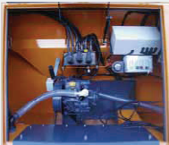
Im wartungsfreundlichen Aggregaterraum (EP 44) sind alle zentralen Komponenten leicht und überschaubar für Wartungsarbeiten untergebracht. Die Klapptür schützt gegen Regen/Schnee.

SW - Antriebsrad Eine sehr flexible Option, die den Streuer unabhängig vom Fahrzeug macht. Von Epoke® A/S patentiert.