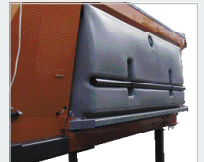
Solettanks vom Spezialdesign für gleichmäßige Füllung/Entleerung.