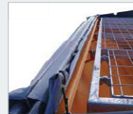
Bedienungsfreundliches Planenklappdach mit Verriegelung und voller Behälteröffnung.