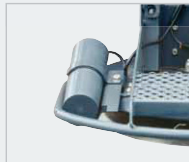
EpoFactor - die berührungslose, elektronische Streukontrolle von Epoke® A/S patentiert.