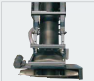
Patentierter Streuteiler mit Mischkammer sorgt für eine 100%ige Durchmischung von Salz und Sole.